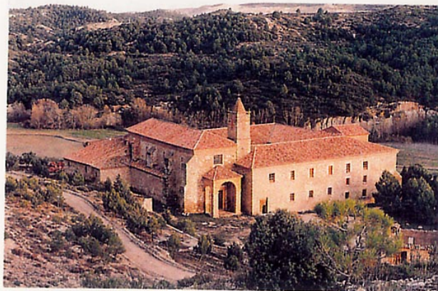
Vista general del monasterio. Fachadas oeste y norte. Siglos XVI y XVII