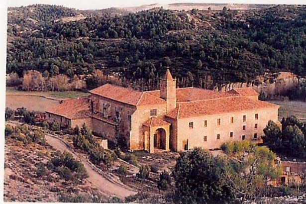
Vista general del monasterio. Fachadas oeste y norte. Siglos XVI y XVII

El Monasterio de Santa María del Olivar está situado en un fértil valle a 700 metros de altitud sobre el nivel del mar, en la provincia de Teruel, a 4 km de Estercuel. Rodeado de chopos y pinos, con abundantes y frescas aguas, aislado y con un aroma místico, es un lugar idóneo para el descanso, la práctica del Yoga y una grata convivencia.